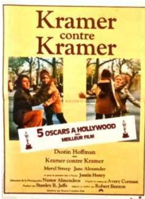
Affiche du film Kramer contre Kramer (1979) de Robert Benton.

Le film explore les conséquences du divorce ainsi que les droits des mères et des pères. Joanna Kramer quitte son mari Ted et leur enfant, Billy, laissant ce dernier sous la seule garde de Ted. Après une introspection psychanalytique, Joanna engage une lutte judiciaire (d'où le titre du film) afin de récupérer la garde de son fils.